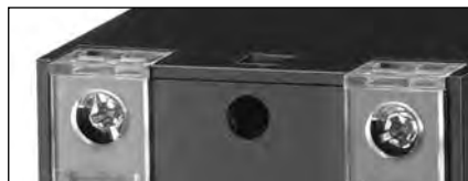
Art.Nr.: T051.687 (2 Stück/Zähler werden benötigt)