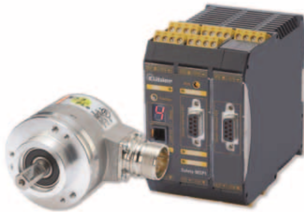
Bild 2: Sendix SIL-Drehgeber und Safety-M-Modul SP1 bilden ein effektives System für funktionale Sicherheit.

Sicherheitsfunktionen zur Sensor-/Aktorverarbeitung bieten eine erhebliche Vereinfachung in der Programmierung. So kann beispielsweise der Programmieraufwand zum logischen/zeitlichen Vergleich von Mehrfacheingängen der Sicherheits-sensorik entfallen. Anstelle dessen wird die nötige Verarbeitung schnell und sicher über das Peripherie-Konfigurationsmenü ausgewählt. Im Programmmeditor erscheint jedes Eingangs- und Ausgangelement nur als Funkti-