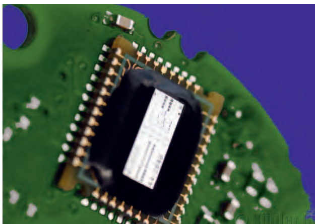
1 Das Sensor-Herz der Absolutdrehgeber ist die hochintegrierte ASIC-Technologie

che Fixier- und Montagelösungen beziehungsweise mehrere Alternativen in der Anschlusstechnik. Zum Standardprogramm zählt zum Beispiel die preisgünstige M12-Anschlusstechnik, M23-Stecker und die großen MIL-Stecker, was für Geber mit kompakter Bauweise nicht üblich ist. Dies ermöglicht dem Anwender, ganz spezielle, auf seine jeweiligen Applikationen abgestimmte Drehgeberversionen auf der Basis eines Standarddrehgebers zusammenzustellen, der im Gegensatz zu Sondergeräten direkt verfügbar und auch um einiges preiswerter ist.