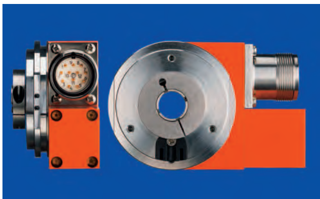
3 Besonders flacher Multiturn-Drehgeber mit berührungsloser Multiturnstufe und einer Einbautiefe von 40,5 mm

Steht hingegen nur wenig Einbauraum zur Verfügung und werden große durchgehende Hohlwellen gebraucht oder ist eine hohe Flexibilität durch Programmierbarkeit (Skalierbarkeit, Steuerausgänge und andere Zusatzfunktionen) gefordert, dann ist die elektronische, berührungslose Technologie optimal. Die Rundenzählung profitiert aus den Vorteilen der elektronischen, berührungslosen Technologie und ist daher besonders raumsparend. Es stehen Wellen- und Hohlwellendrehgeber in Singleturn- (maximal 17 bit) und Multiturn- (maximal 29 bit) Ausführung zur Verfügung.