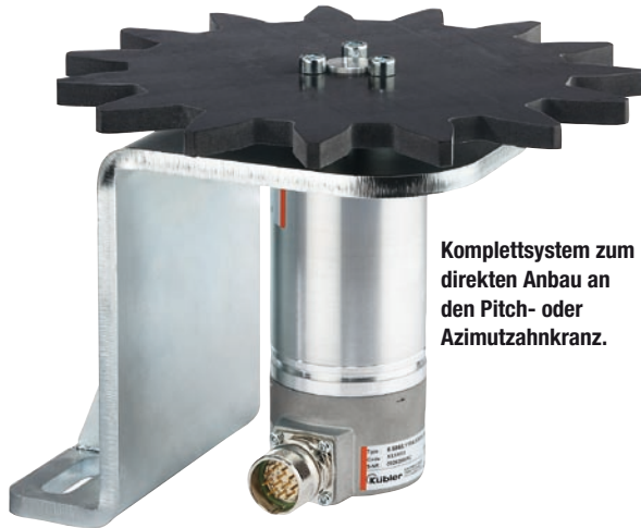
Komplettsystem zum direkten Anbau an den Pitch- oder Azimutzahnkranz.

die Drehgeber durch Zuverlässigkeit und Verfügbarkeit für den Einsatz im Offshore-Bereich.