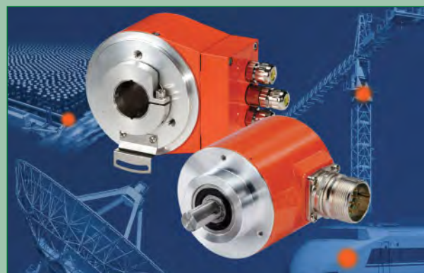
Abb. 3: Gerade bei Anwendungen im rauen Einsatz oder geringen Platzverhältnissen profitieren Anwender von den Vorteilen der ‚Multiturns‘.