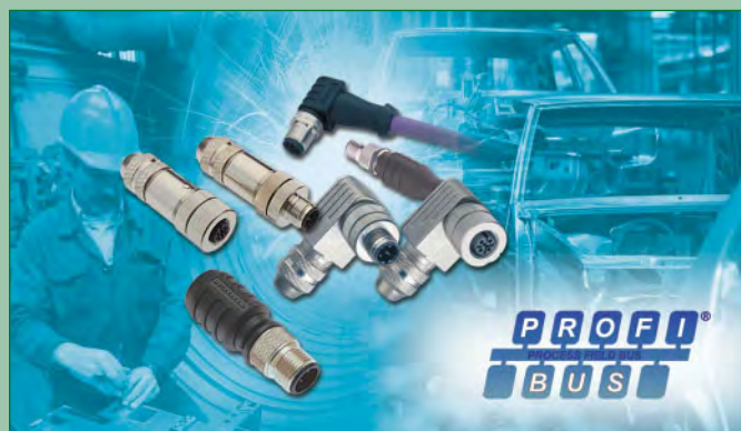
Abb. 2: Das M12-Anschlussprogramm von Kübler ist zugeschnitten auf alle Profibus DP-Applikationen.